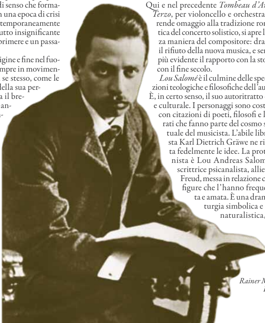
Rainer Maria Rilke.